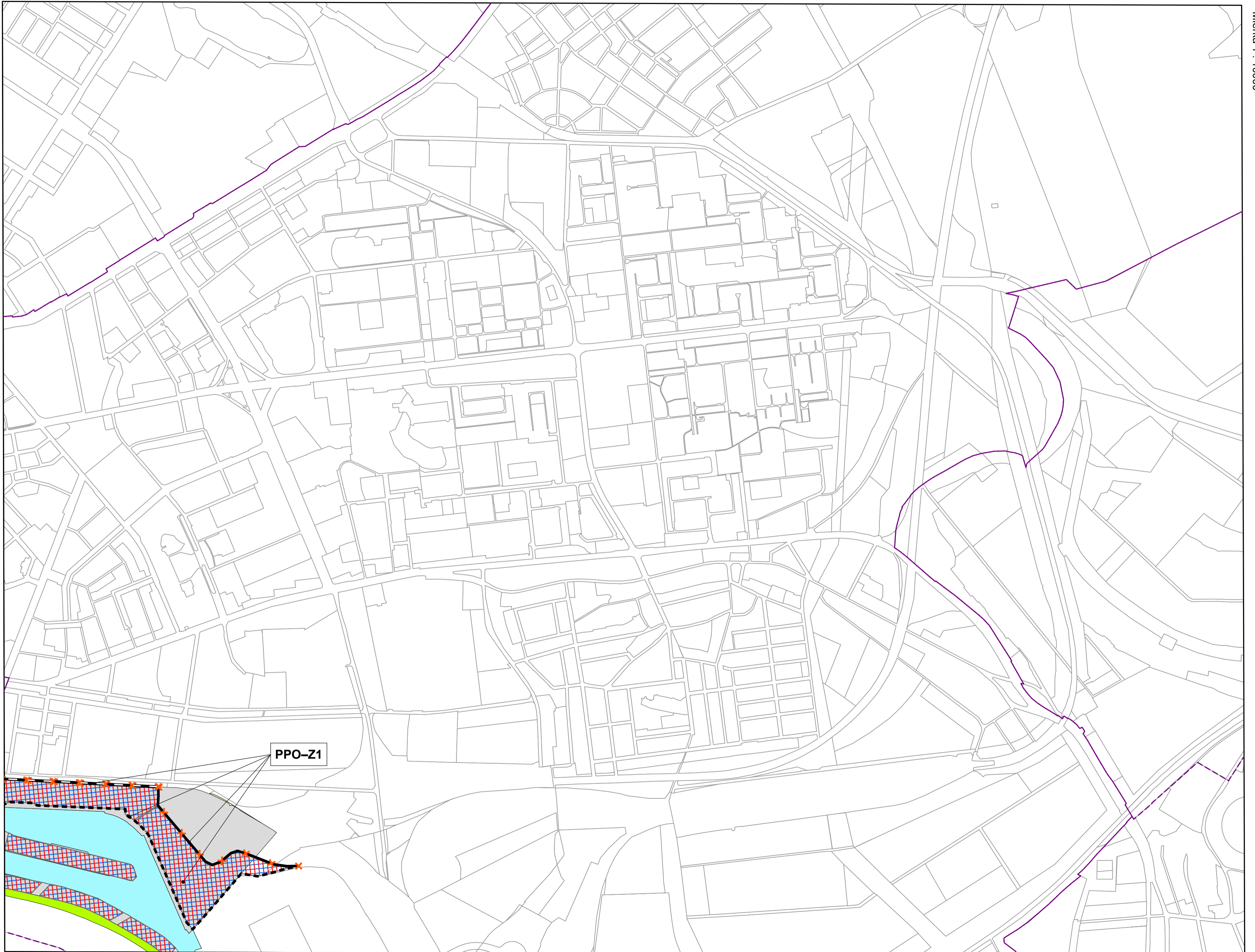
ZaD 16 - návrh